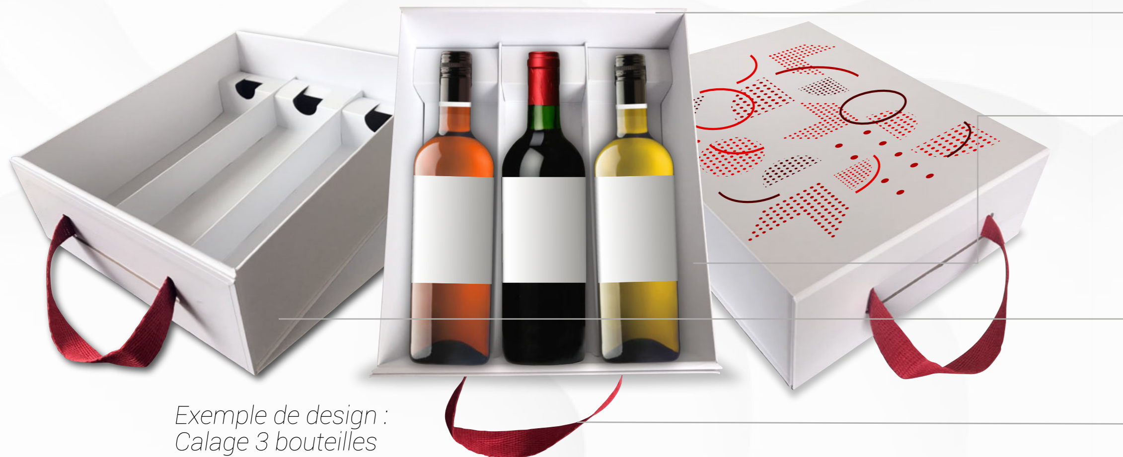
Exemple de design : Calage 3 bouteilles