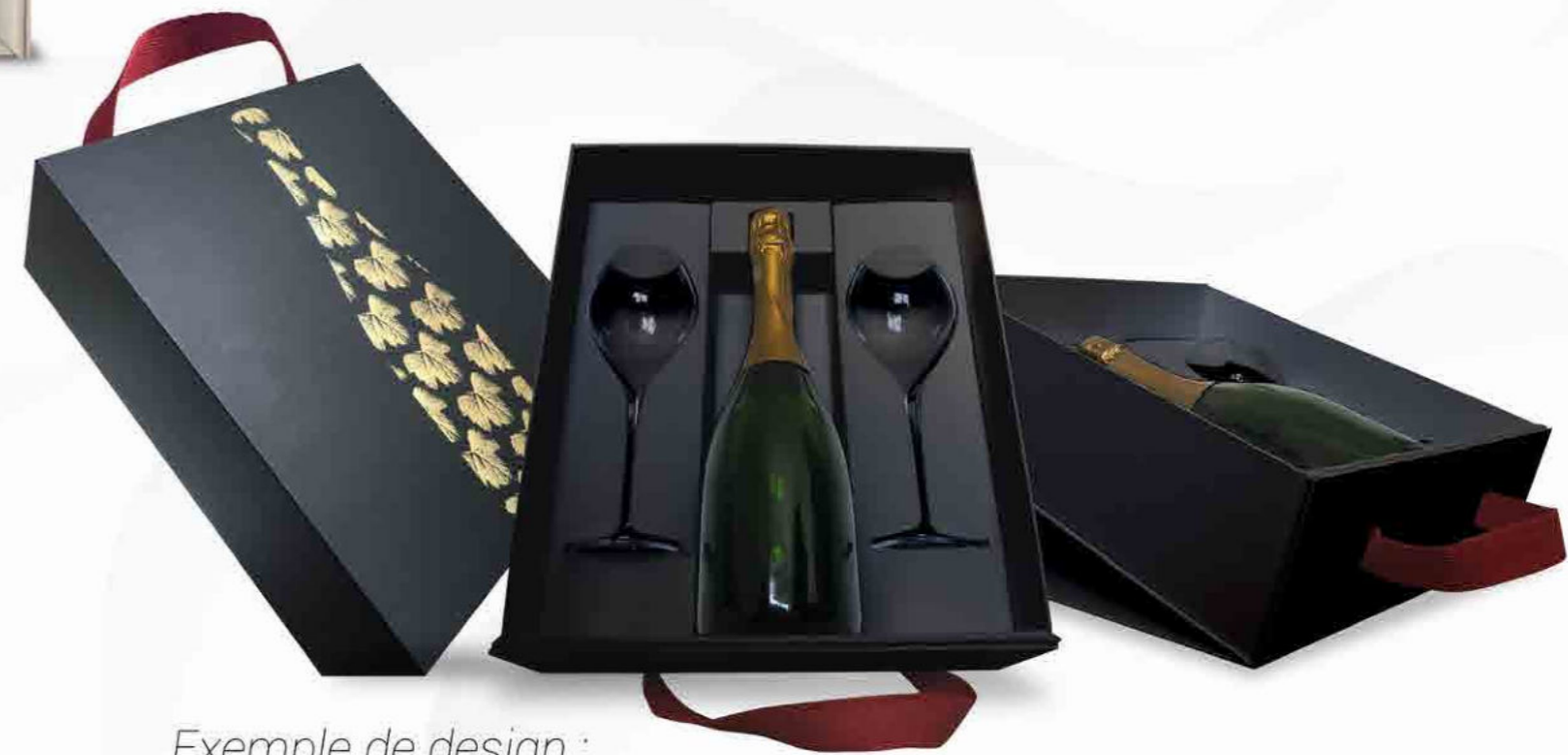
Exemple de design : Calage 1 bouteille + 2 verres