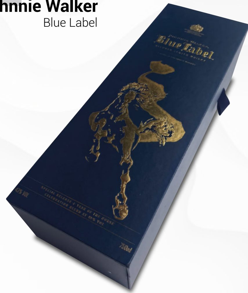
Johnnie Walker Blue Label