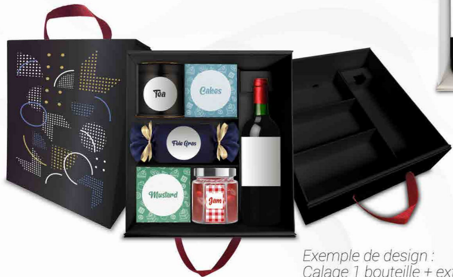
Exemple de design : Calage 1 bouteille + extras