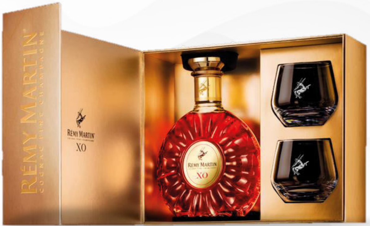
Rémy Cointreau XO & VSOP