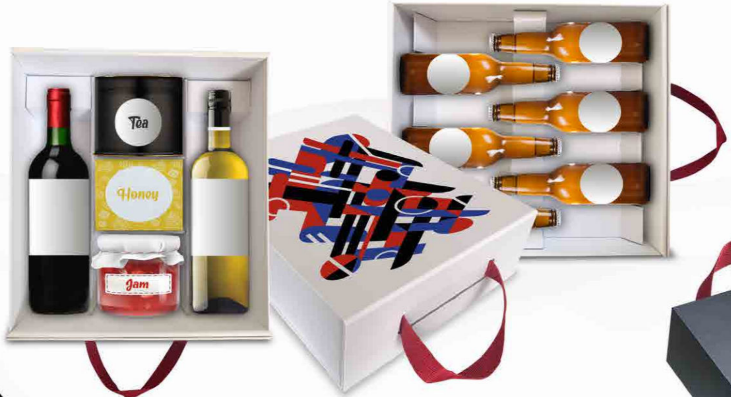
Exemple de design : Calage 2 bouteilles + extras Calage pour bières